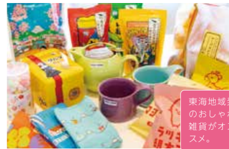
10 メイドイントーカイ 10:30-19:30

おみやげにも自分用にも◎ 日本全 国のかわいい雑貨とお菓子のお店。旅行 関係の書籍も取り扱っています。