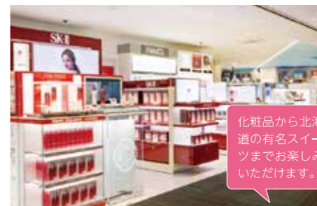
14 DUTY FREE SHOP ※国際線就航時間に合わせて営業

免税店でのショッピングは海外旅行 の楽しみのひとつ! 広いフロアで品 揃え豊富。ご搭乗お待ちしております!