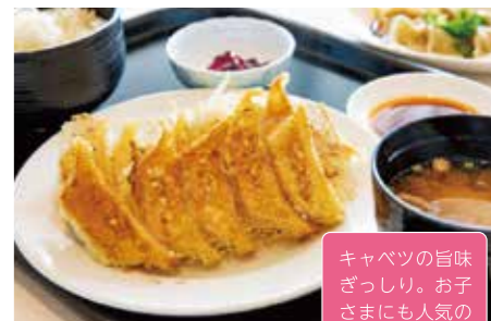
4 元祖浜松餃子 石松 10:30-19:30 (19:15 L.O.)

旅行お疲れさまでした。ぎょうざと ビールで一杯いかが? ビールセット ¥980、定食 ¥980~。