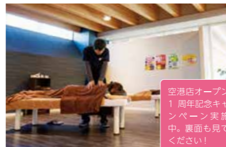
13 気軽な手もみ屋 もみかる 10:30-18:00

空き時間にオススメ! 全身もみほぐし 15分 ¥990~。3階にあります。お気 軽にご来店ください。