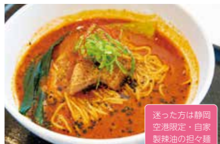
5 麺屋燕 10:30-19:30 (19:15 L.O.)

人気店の味を空港で! 限定担々麺にす るか、焼津の鰹出汁ラーメンにするか ...カレーセットも捨てがたい!