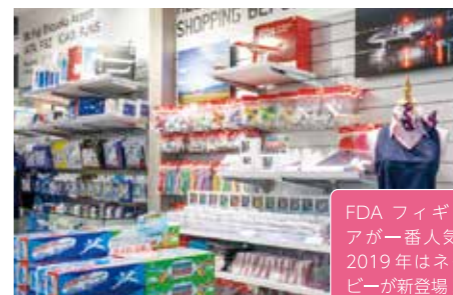
7 Runway Shop FSZ 10:30-19:30

子どものおもちゃからマニア向けま で... 憧れの飛行機グッズいろいろ。 お気に入りが見つかるかな?