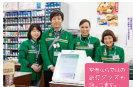
12 セブン-イレブン 6:40-22:00