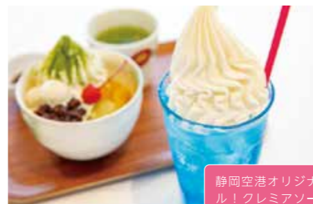
6 TABI CHA FE 9:30-19:00 (18:45 L.O.)

人気のクレミアソフトを使ったス イーツがオススメ! 軽食やドリン グメニューも充実。