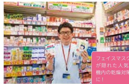
11 マツモトキヨシ 10:30-19:30

買い忘れはありませんか? 旅行前 にチェック! 便利な小物も旅先で心 強い胃腸薬もお任せください。