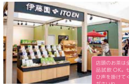
9 伊藤園 10:30-19:30

手頃な品から贈答用までお茶 の種類は 40 以上! 季節のオス スメのお茶を聞いてみよう。