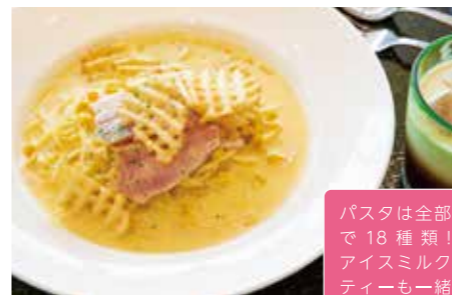
2 パスタ屋一丁目 10:30-19:30 (19:15 L.O.)

ただ今開店記念 キャンペーン中! マグロ握り通常 ¥2,200→¥880。 売り切れゴメン。