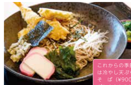
3 東海軒 富士見そば 10:30-19:30 (19:15 L.O.)

JR 静岡駅の名店が空港に登場。 立ち食いとは違う富士見そばを お楽しみください!