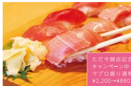
1 清水港 海山 10:00-21:00 (20:30 L.O.)

静岡らしいマグロ尽くしのセットメ ニューが豊富! 飛行機 & 富士山を見な がら味わおう。21時まで営業。