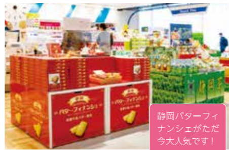
8 しずおかマルシェ 7:00-19:00

静岡の定番みやげ & 新商品がいつも 揃って便利。空港周辺の農家さんのお 茶コーナーにもご注目ください。