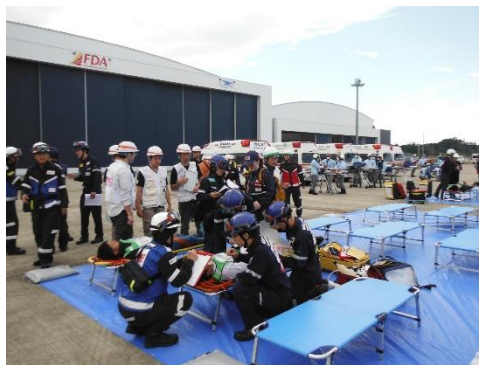
航空機事故対応訓練の様子（2018年）