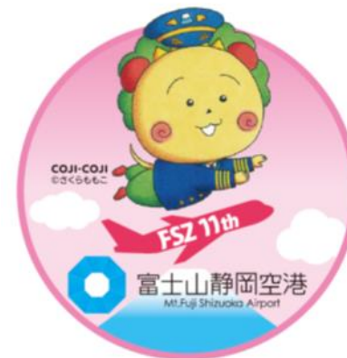
開港11周年キャンペーン マスコット「コジコジ」