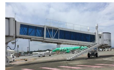
ボーディングブリッジ 設置イメージ （現在の4番スポット）