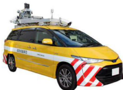
保守・管理システム「インフラドクター」 AI搭載のバキューム清掃ロボット「Whiz」