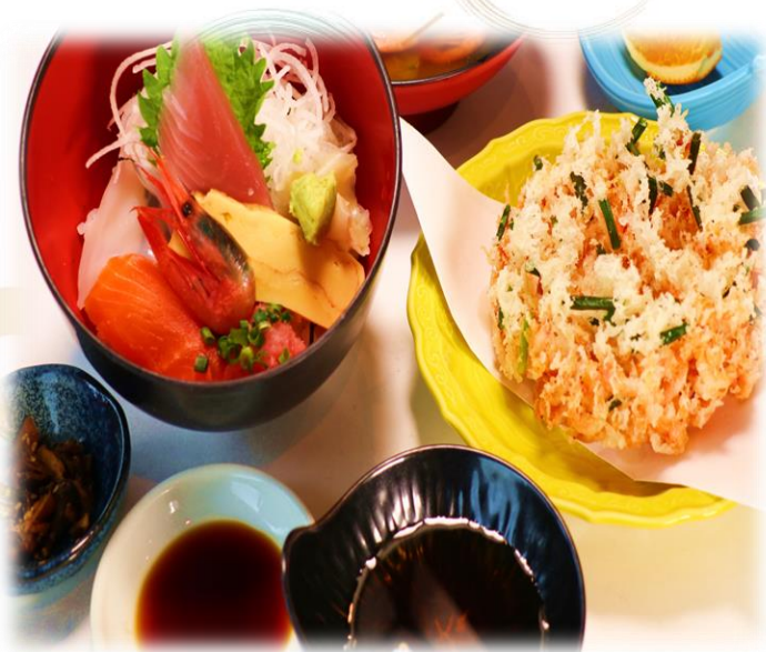
(24) 花ちらし (ミニちらし、桜えびのかき揚げ) 1780円