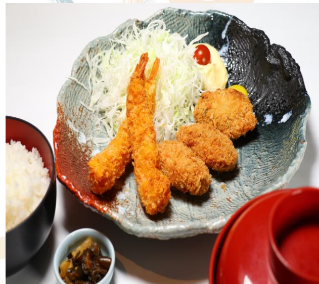
(27) 海老とカキフライ定食 1580円