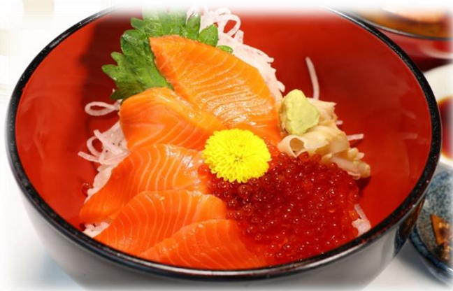
(12) サーモンといくらのお 親子丼 (最高の組み合わせ!) 2480円