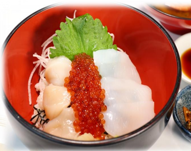
(13) 北海三色丼 (ホタテ、いくら、イカ) 2580円