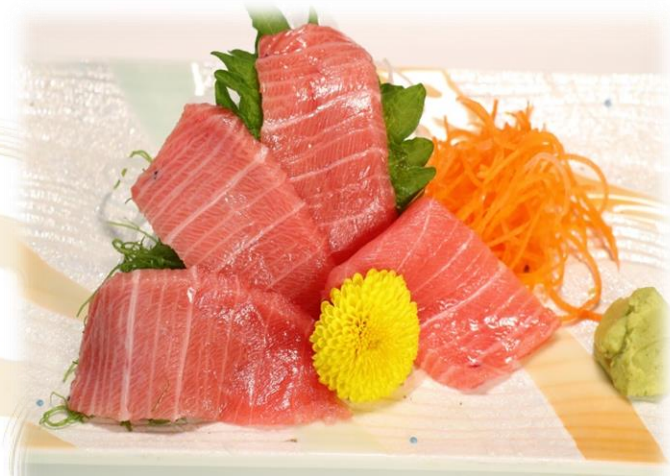
(51) 本まぐろトロ刺し 1880円