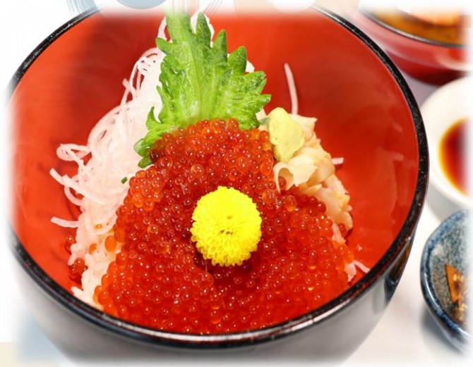
(11) いくら丼 (プチプチな食感) 2880円