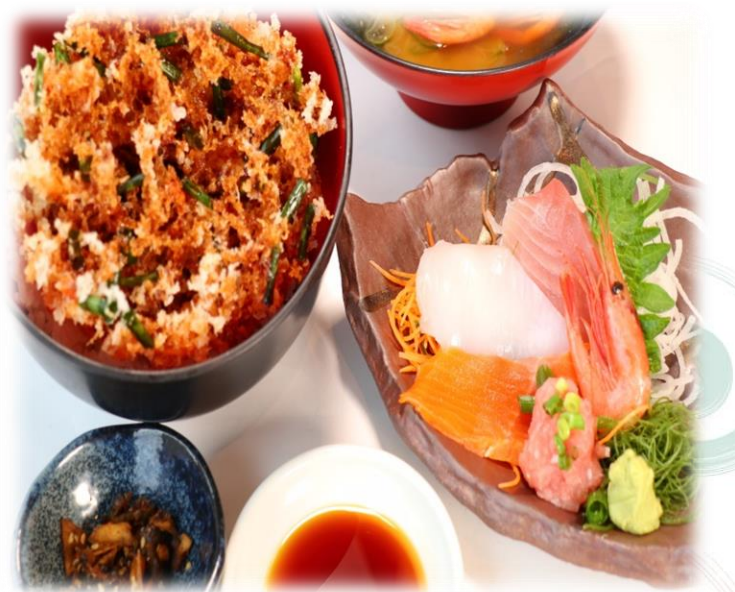
(25) さくら天 (桜えびのかき揚げ丼、お刺身) 1780円