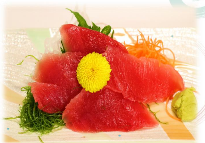
(52) まぐろの赤身刺し 1180円