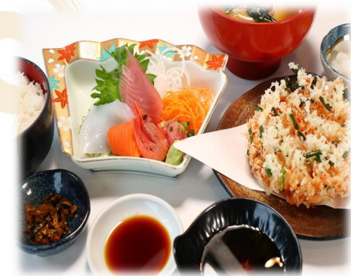
(26) 天刺し (桜えびのかき揚げ、お刺身) 1780円