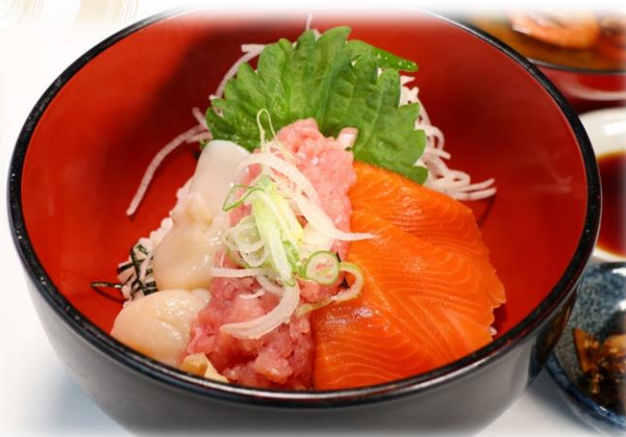
(14) 津軽三色丼 (ホタテ、ねぎとろ、サーモン) 2280円