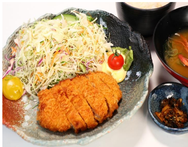
(28) 三元豚のとんかつ定食 1780円