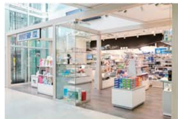
空港グッズ専門店