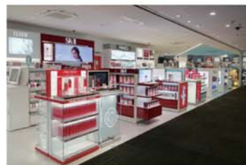
免税売店(国際線搭乗待合室内)

また、空港付帯施設・設備(石雲院展望デッキ・電気自動車充電所)の管理も行っています。