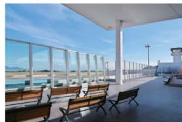
ターミナルビル3F展望デッキ

富士山静岡空港の旅客・貨物ターミナルビルの管理・運営を行っています。 ビル設備の管理はもちろんのこと、利用される方の安全を確保するための保安警備業務、富士山静岡空港を盛り上げるために各種イベントなども企画・実施しております。安全・安心をモットーに、静岡の空の玄関口にふさわしい、空港創りを目指しております。