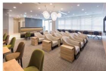
ビジネスラウンジ

6月には開港イベント、9月には空の日イベントを開催し、毎年たくさんのお客様に空港にお越しいただいております。また、周辺市町との連携を図り、周辺観光地の魅力度の向上に努めています。