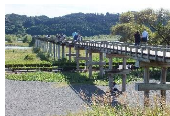
蓬莱橋 (ほうらいばし)