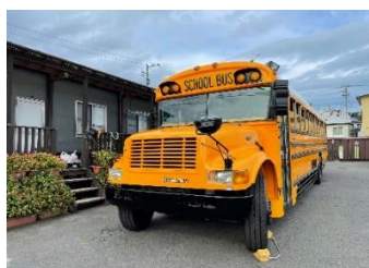
アメリカンスクールバス

大井川にかかる「蓬莱橋」は全長 897.4m で世界一の長さを誇る木造歩道橋です。全長 897.4m から「やくなし＝厄無し」の語呂合わせで縁起のいい橋。また「長い木の橋」から「長生きの橋」として度々メディアでも取り上げられます。橋のたもとの「897.4 茶屋」にて地元島田産のお茶を使用した絶品煎茶ジェラートを召し上がってください。